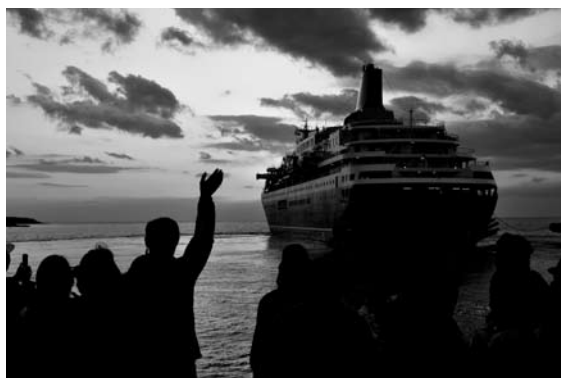
2010 日本港湾協会会長賞 「無事を願い」(千葉県新井海岸) 植木喜晃