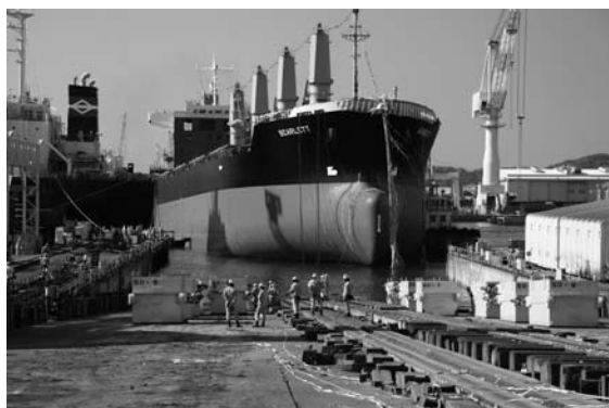
2010 国土交通省港湾局長賞 「進水式」(高知県浦戸湾) 石川賢一