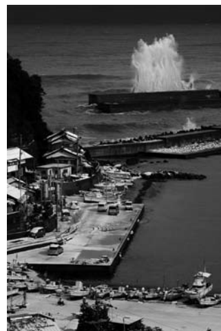
2010 港湾海岸防災協議会会長賞 「荒れる外海」(鳥取県浜村港) 山崎秀司