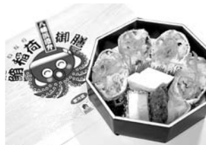
【八幡浜港】鯛稻荷御膳 (認定第3号)