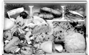
【八幡浜港】ちゃんぽん弁当 (認定第2号)