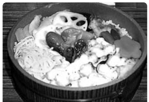
【神戸港】たこしゃぶちらし (認定第4号)