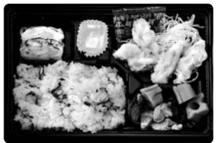
【別府港】港弁タコ飯 (認定第5-2号)