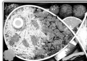
【八幡浜港】鯉ひつまぶし弁当 (認定第1号)