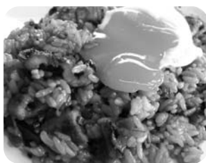
第1回、第4回 たまの温玉めし 【みなとオアシス宇野】

平成26年までに5回の全国大会が開催され、毎回多くの来場者が各地のSea級グルメを堪能しています。また、来場者の投票によりグランプリが決められています。