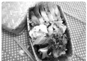
【苫小牧港】ホッキ大漁弁当 (認定第1401号)