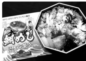
【八幡浜港】鯛めし (認定第6号)