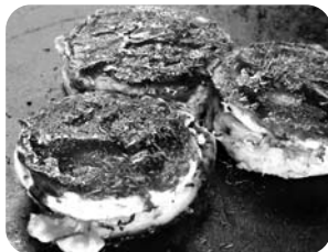
第5回 多幸のみ焼き 【みなとオアシス瀬戸田】