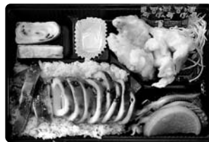
【別府港】港弁イカ飯 (認定第5-1号)