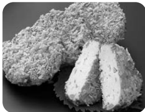
第3回 じゃこカツ 【みなとオアシス八幡浜みなと】