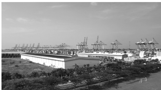
広大な敷地を有するタンジュンペラパス港

易地域）の整備が行われ、1998年には政府の財務当局より正式にその運営権が与えられている。