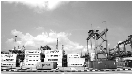
タンジュンペラパス港コンテナターミナル： マースクとエバーグリーンのコンテナ貨物

タンジュンペラパス港の開発は、1990年代、マハティール首相（当時）のもと、シンガポールへの海運依存脱却のための国策の一環として進められ、用地造成はジョホール港湾当局により、岸壁・ターミナル等の開発・運営は、マレーシアの大手複合企業であり、港湾運営やエネルギー事業、トンネル建設等を手掛けるMMC（Malaysia Mining Corporation）と、オランダを拠点とするマースクラインの子会社、APMターミナルズとの共同出資（それぞれ資本70%、30%）により行われてきた。現在、共同企業体として活動するPTP（Pelabuhan Tanjung Pelepas Sdn Bhd）は、1995年から60年間の開発・運営権をマレーシア政府より与えられ、1997年に整備を開始、その敷地面積は3,500エーカー（約1,400ha）にも上る。広大な背後地には、ターミナル整備と並行してフリーゾーン（自由貿