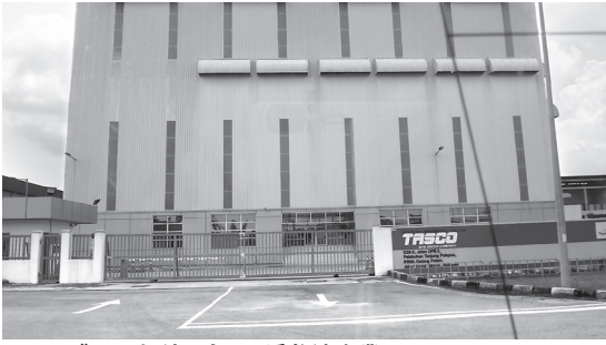
フリーゾーンを利用する日系物流企業

スクは、貨物の85%をタンジュンペラパス港にシフト、シンガポール港は当時、年間取扱量の約1割を失っている。以降、シンガポール港も対抗して、COSCO、MSCらの出資を得てターミナルの共同運営を開始する等、東南アジアにおけるコンテナ積替えハブ港としての競争が本格的にスタートすることとなった。現在、タンジュンペラパス港は世界の300以上の港を繋ぐ90以上のウィークリーサービスを提供しており、コンテナ取扱量では未だシンガポール港の4分の1と及ばないものの、マラッカ・シンガポール海峡に位置するハブ港としてシンガポール港と対抗している。