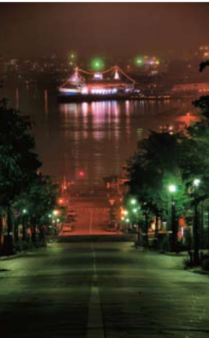
2008 Bountiful Waterfront Photo Competition (Hakodate Port) 2008 풍요로운 워터프론트 사진 콘테스트 (하코다테항) 2008年精彩的滨水区照片竞赛(函馆港)