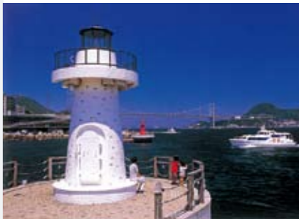
Shimonoseki Port Lighthouse and Kanmon Bridge 시모노세키항 등대와 간몬교 다리 下关港 灯塔和关门桥