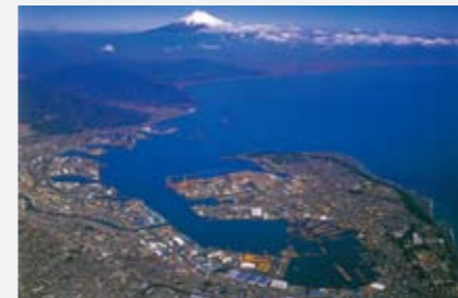
Shimizu Port Commanding views of Mt. Fuji, the highest in Japan 시미즈항 일본 제일의 후지산을 바라본다 清水港 眺望日本首屈一指的富士山