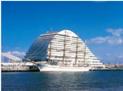
Kobe Port A historical port for sailing vessels 고베항 범선을 맞이하는 역사깊은 항 神户港 迎来帆船的历史悠久的港口