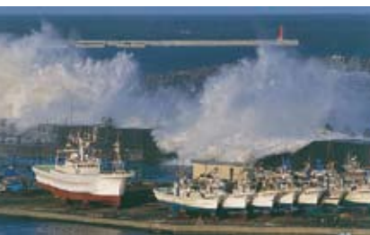
2001 Bountiful Waterfront Photo Competition (Tokachi Port) 2001 풍요로운 워터프론트 사진 콘테스트 (도카치항) 2001年精彩的滨水区照片竞赛(十胜港)