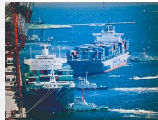
2003 Bountiful Waterfront Photo Competition (Tokyo Port) 2003 풍요로운 워터프론트 사진 콘테스트(도쿄항) 2003年精彩的滨水区照片竞赛(东京港)

PHAJ已经设立港口政策研究所(JIPPS)，开始研究有关港口开发政策、港口管理、港口安全等。运用JIPPS的研究以及协会和会员积累的知识，PHAJ对有关日本港口的振兴和发展的政策提出建议，有助于解决各种问题。