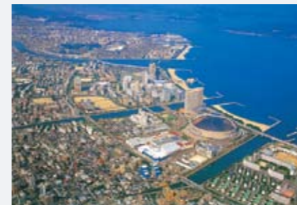
Hakata Port Seaside Momochi artificial beach 하카타항 씨사이드 모모치 인공 해변 博多港 百道海滨公园 (人工海滩)